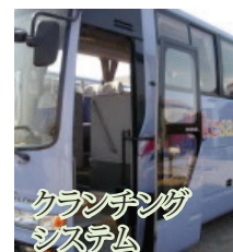
クラウチングシステム